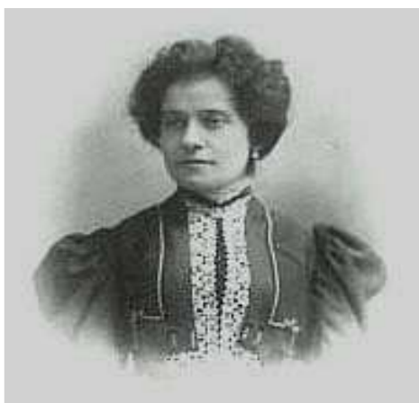
(Ada Negri – Poetessa e Scrittrice)